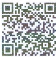
ระบบส่งมอบงานของ บนธ.2