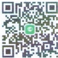
Line Group สำหรับงานกรมคุมประพฤติ